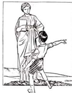
Em "O Minotauro", o pessoal do Sítio Picapau Amarelo conhece a Grécia Antiga e os seus mais famosos mitos. É um livro divertido onde aprendemos muito sobre a mitologia e personagens históricos.